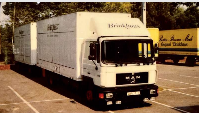
1992 – Fuhrpark der Firma Brinkhaus