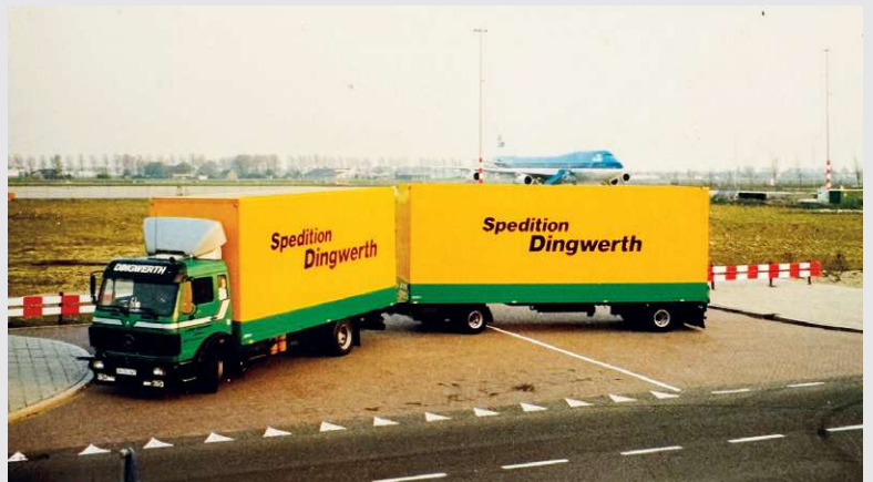
1988 – Anschaffung erster Koffer-LKW