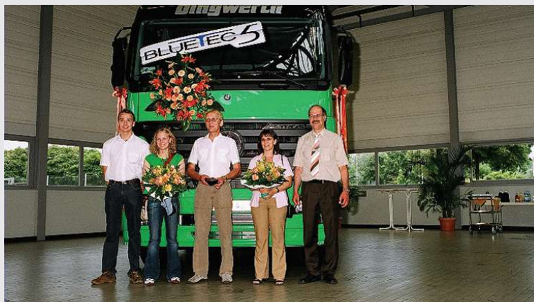
2005 – Familie Dingwerth bei der Übergabe

Abholung der 10 neuen LKW ab Werk in Würth. Erweiterung des Fuhrparks von 20 auf 30 LKW.