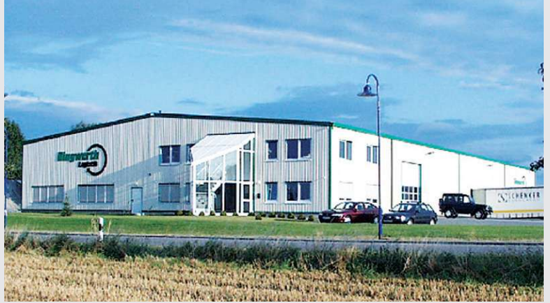
1997 – Inbetriebnahme in Gera

Inbetriebnahme einer neu erbauten Lager- und Logistikhalle in Gera.