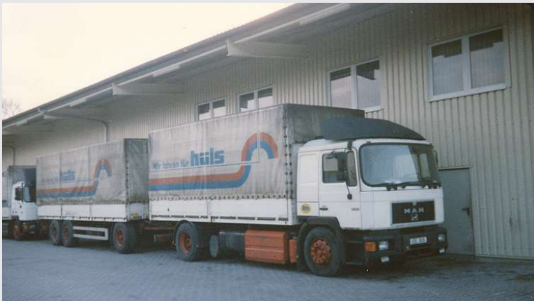
1996 – Übernahme der Firma ARS

Die Belegschaft ist auf 25 Personen herangewachsen.