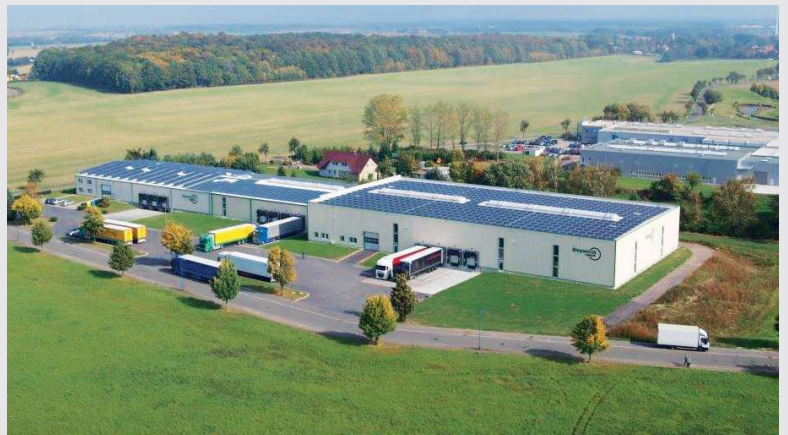
2017 – Abschluss der 3. Bauphase in Gera

Erweiterung des Standortes Gera um weitere 3.000 m 2 auf insgesamt 6.000 m 2 Lagerfläche. Fertigstellung der Hofflächen und Außenanlagen.