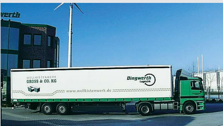
2001 – Einsatzfahrzeug für die Firma Gross