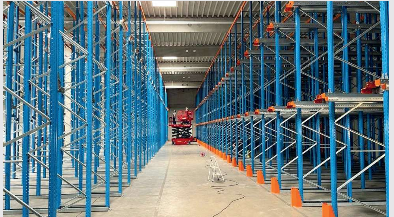
2023 – neue Regalanlage im Terminal 2 in Beelen

Inbetriebnahme der neuen Regalanlage im Terminal 2 in Beelen. Die Kapazität erweitert sich dadurch auf 7.500 Paletten im Terminal 2.