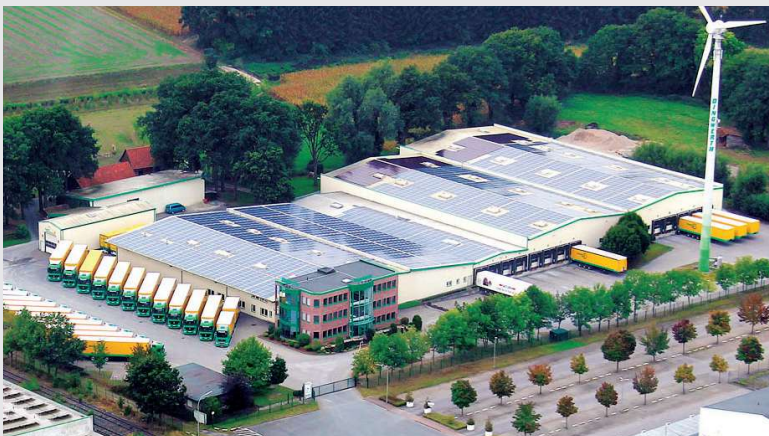
2010 – Neue Photovoltaik-Anlage