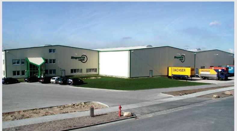
2003 – Erweiterung des Standortes Bremen

Erweiterung des Standortes Bremen auf 9.000 m 2 .