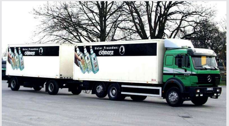
1998 – Fuhrpark der Firma Schwarze

Übernahme des Fuhrparks der Firma Schwarze (Westfälische Kornbrennerei).