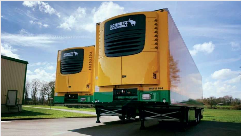
2020 – zwei neue Schmitz Cargobull Kühlaufleger