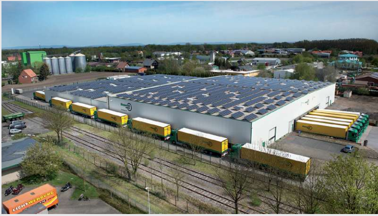
2008 – Terminal II