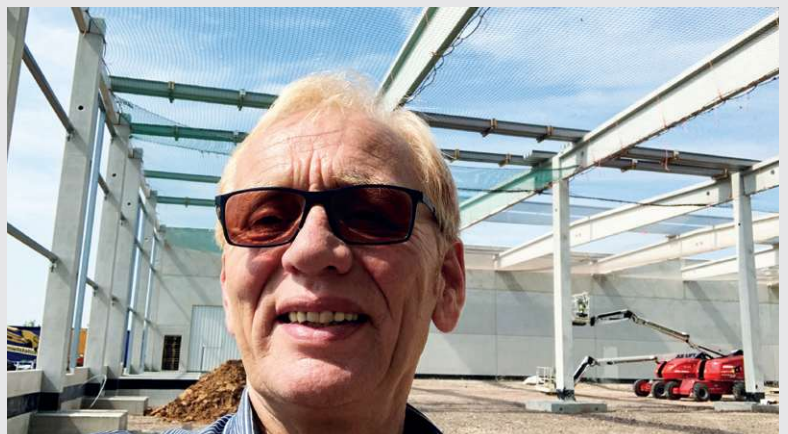
2019 – Bauabschnitt Halle 3 in Föhren