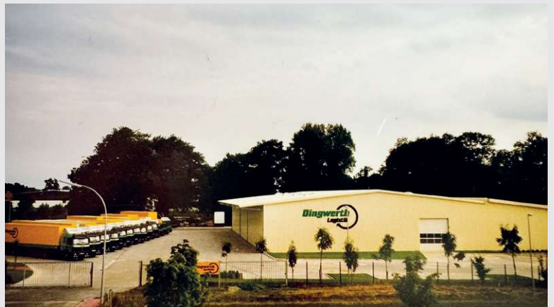
1993 – Fertigstellung des 2. Neubau in Beelen

Fertigstellung des 2. Neubau mit Hofflächen und Außenanlagen in Beelen.