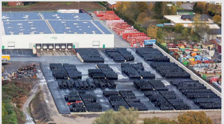
2012 – Reifen- und Felgenlager auf 14.000 m 2

Einrichtung des Reifen- und Felgenlagers auf 14.000 m 2 .