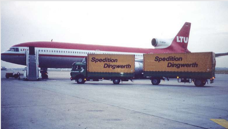
1985 – Anlieferung am Düsseldorfer Flughafen