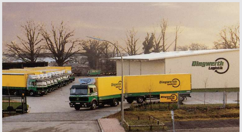
1994 – Standort Beelen

Fuhrpark-Erweiterung auf 14 Fahrzeuge. Hallen-Erweiterung in Beelen auf 5000 m 2 .