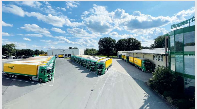
2023 – neue Hofflächen in Beelen

Neugestaltung einer zusammenhängenden, großzügigen Hoffläche zwischen den Terminals in Beelen.