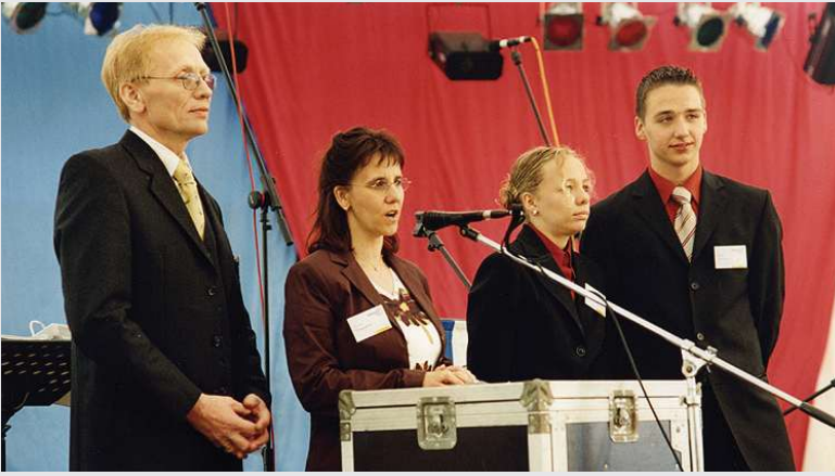
2004 – Familie Dingwerth bei der Begrüßung