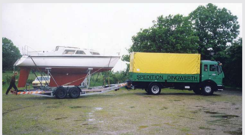
1982 – Transport einer Motorjacht

Der erste „nagelneue“ LKW wird angeschafft.