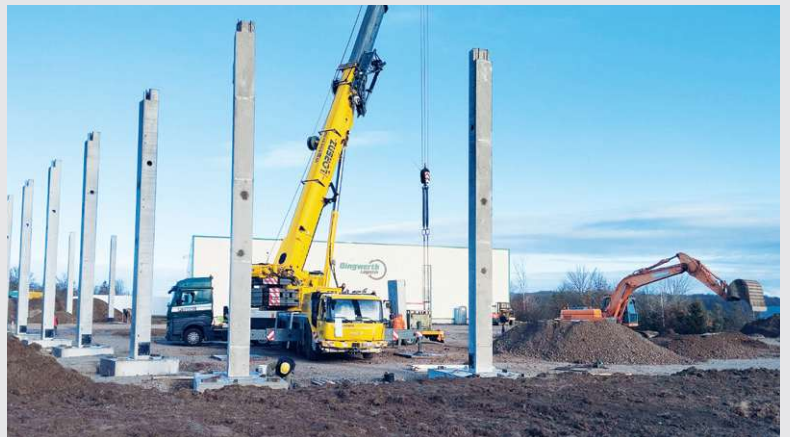
2023 – Bauabschnitt 4 in Gera

4. Bauabschnitt in Gera – der Standort wird um weitere 3.000 m 2 WGK-Lagerfläche erweitert.