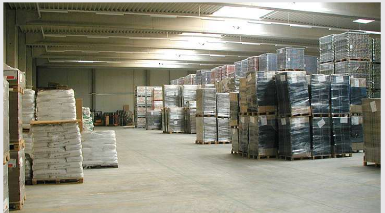
2002 – Lager- und Logistikhalle in Trier/Föhren