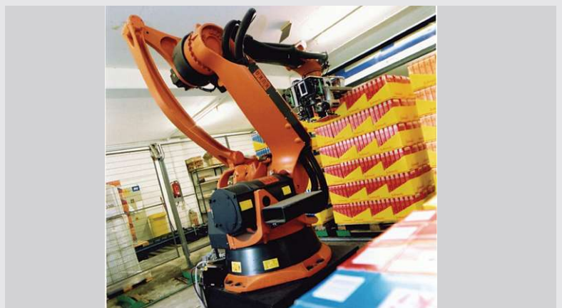
2003 – Roboter für die Sortiment-Erstellung

Einführung eines Roboters für die Sortiment-Erstellung in Beelen.