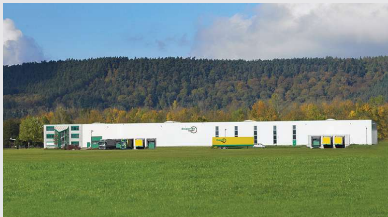
2007 – Kapazitätsausweitung in Trier/Föhren

Erweiterung des Standortes Trier/Föhren. Hallengröße von 3600 m 2 auf 7200 m 2 verdoppelt.