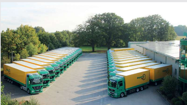
2011 – Aufgestockter Fuhrpark