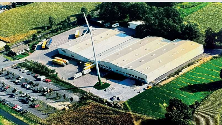
1997 – Fertigstellung der 5. Halle in Beelen

Bau der ersten Windkraftanlage in Beelen.