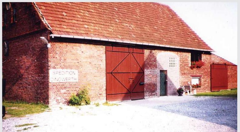
1980 – Standort Greffen an der Haller Straße

Verlegung des Firmensitzes an die Haller Straße in Greffen in eine ehemalige Scheune.