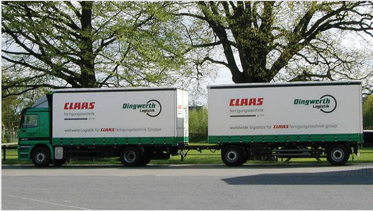
2000 – Einsatzfahrzeug für Claas Fertigungstechnik