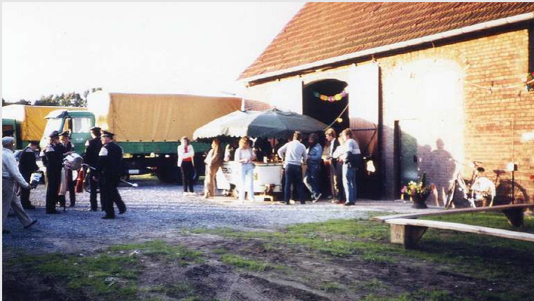
1984 – 5-jähriges Firmenjubiläum in Greffen