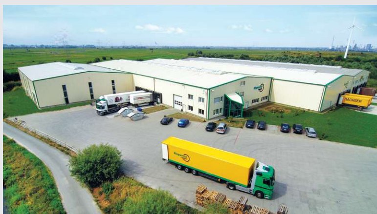
2006 – Bauphase in Bremen beendet

Letzter Bauabschnitt in Bremen abgeschlossen.