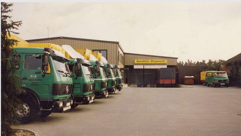
1987 – Standort Greffen an der Fritz-Reuter-Straße