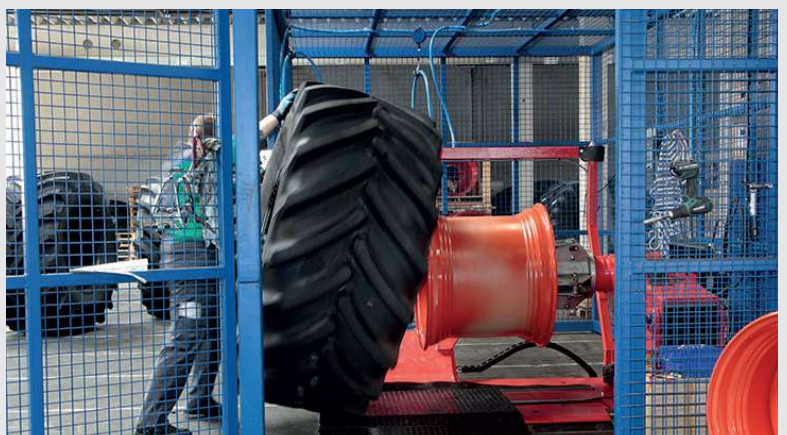
2012 – Montage von Reifen auf Felge

Auf über 2.000 m 2 montieren wir Reifen auf Felgen und liefern diese „Just in time“ direkt an die Fertigungsstätte eines Landmaschinen-Herstellers in Harsewinkel.