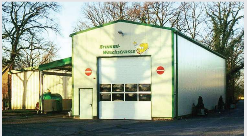
1999 – Bau einer ökologischen LKW-Waschanlage

Errichtung einer ökologischen LKW- Waschanlage sowie einer Diesel- und einer Biodiesel-Kraftstofftankstelle.