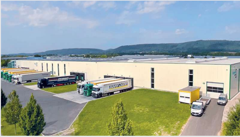
2019 – Bauabschnitt Halle 3 in Föhren