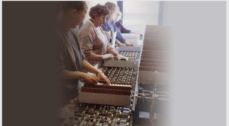
1988 – Erweiterung des Tätigkeitsbereiches

Erweiterung des Tätigkeitsbereichs durch Packen und Sortiments-Erstellung.