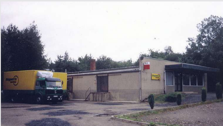
1992 – Eröffnung der Niederlassung Niederfrohna