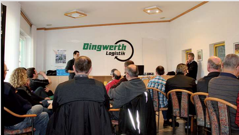
2012 – Einrichtung eines neuen Schulungszentrums

Anschaffung von 7. Plateau-Aufliegern für die Räderlogistik.