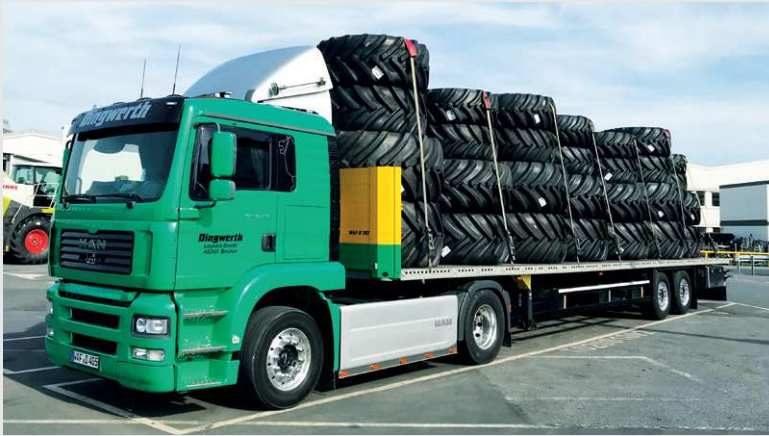
2012 – LKW mit Plateau-Auflieger

Anschaffung von 7. Plateau-Aufliegern für die Räderlogistik.