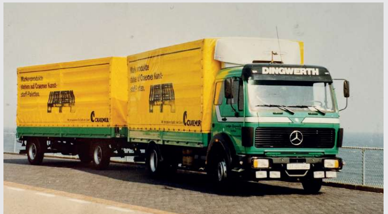
1988 – Fahrzeug mit Kundenwerbung

Fahrzeug mit Kundenwerbung der Firma Craemer aus Herzebrock.