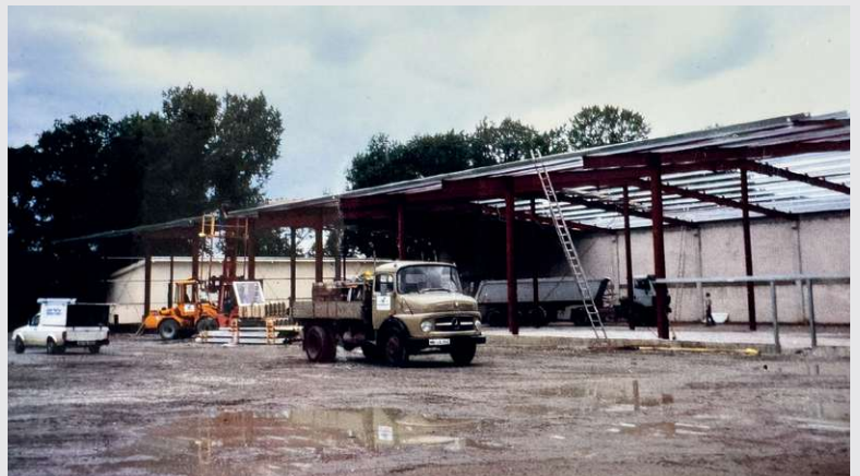
1993 – 2. Neubau in Beelen

Fertigstellung des 2. Neubau mit Hofflächen und Außenanlagen in Beelen.