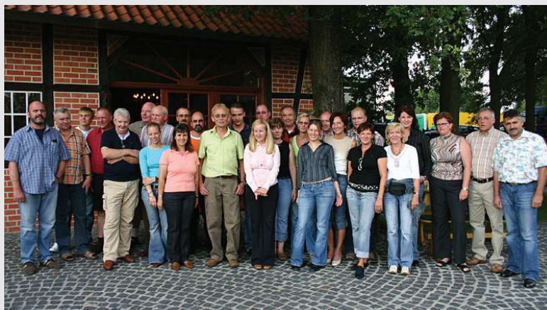
2006 – Unsere Kompetenz auf einem Blick

Der Mitarbeiterstamm wächst auf 81 Mitarbeitende an.