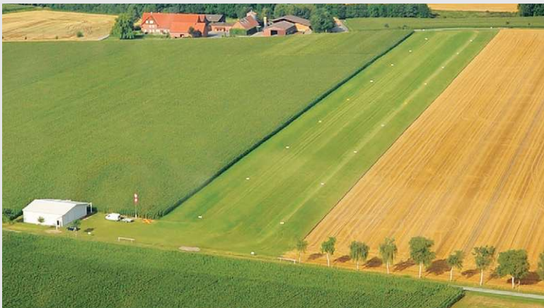
2009 – Eröffnung des Sonderlandeplatzes