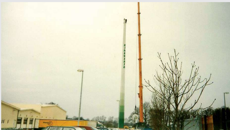
1997 – erste Windkraftanlage in Beelen

Die Übernahme der Firma ARS, Niederfrohna (ehemals Samson in Warendorf).