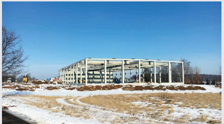
2016 – Rohbau Erweiterung Halle 3 in Gera