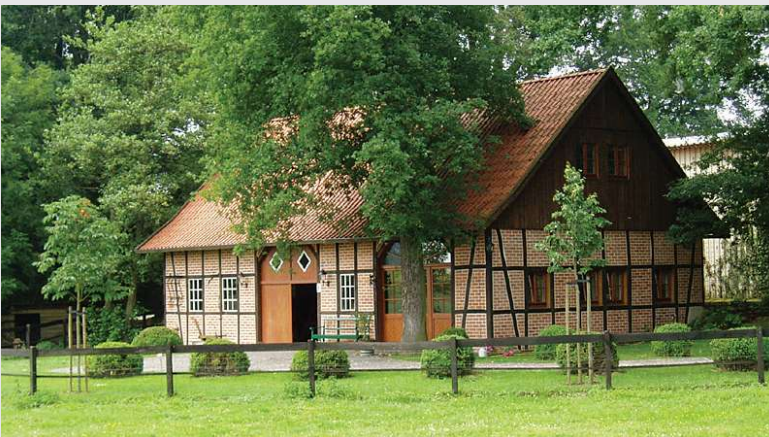
2004 – Die Außenansicht unseres Bauernhauses