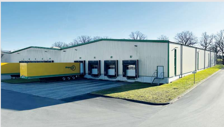
2013 – Anbau Halle 5 in Beelen

Die Berufskraftfahrer der Dingwerth LKW-Flotte werden kontinuierlich durch individuelle Trainingseinheiten geschult. Diese Maßnahme sichert auf Dauer eine optimale Fahrweise. So tragen die Fahrer aktiv zum Unternehmenserfolg bei.