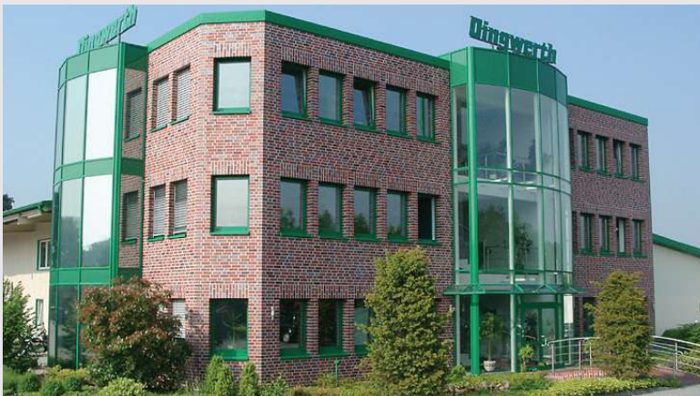
2000 – Neues Verwaltungsgebäude in Beelen