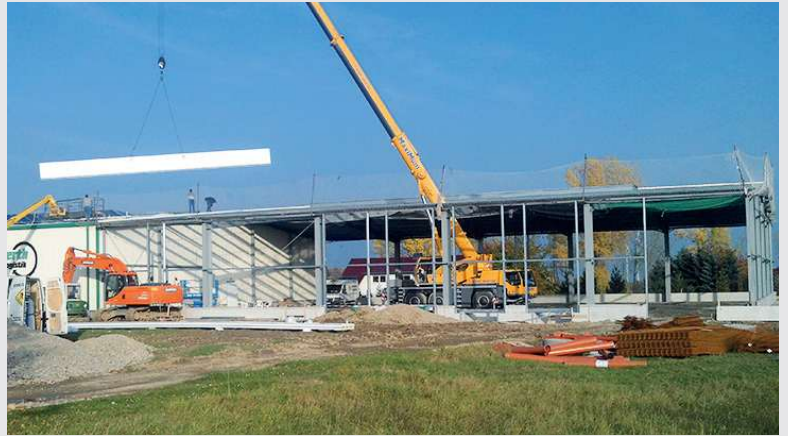
2015 – Erweiterung Halle 2 in Gera

Erweiterung des Standortes Gera um 1.200 m 2 Hallenfläche.