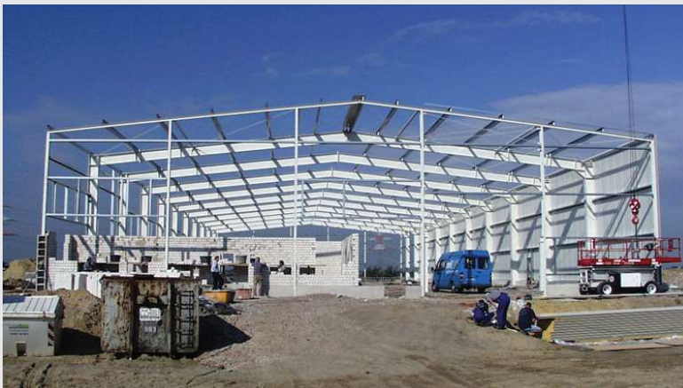
2000 – Neubau in Bremen