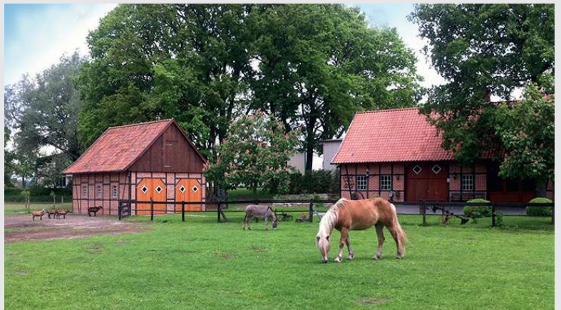
2011 – Neubau einer kleinen Stallanlage

Esel „Rudi“, Pferd und unsere Schafe brauchen Platz. Im Stil unseres Bauernhauses wurde ein traditioneller Stall für unsere Tiere errichtet.