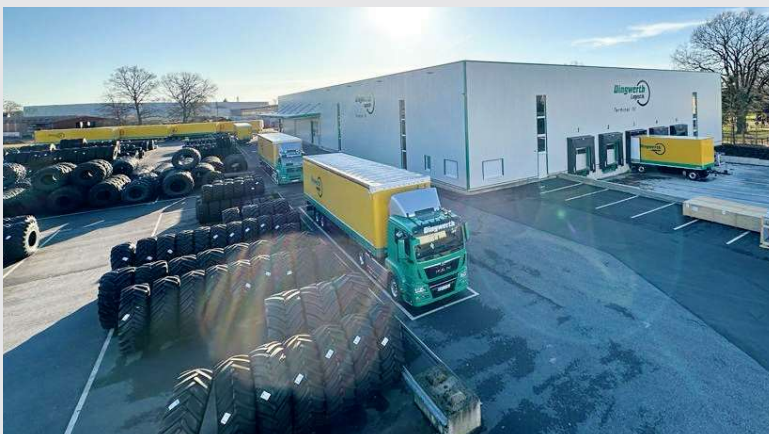
2023 – Fertigstellung Terminal 3 in Beelen