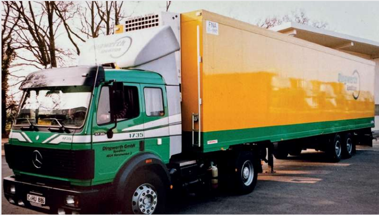
1991 – Anschaffung Kühlaufleger für neues Kundenprojekt