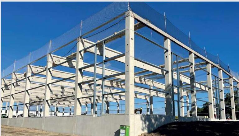
2023 – Neubau Terminal 3 in Beelen