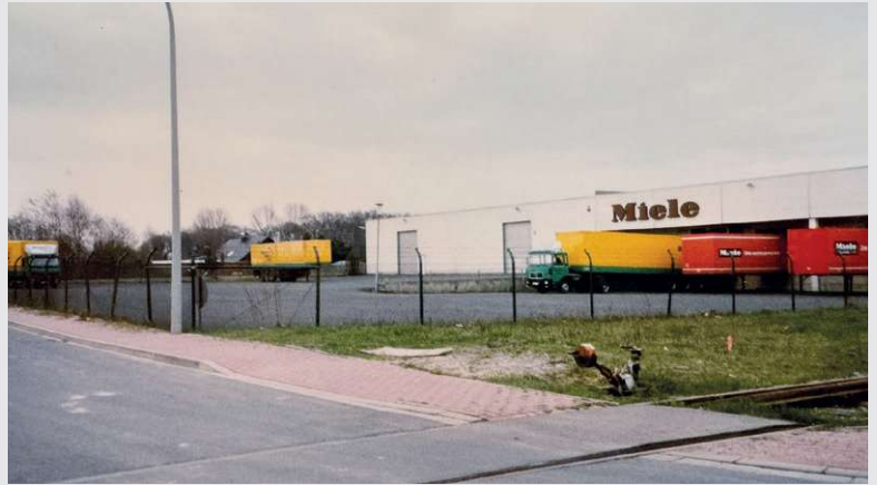
1993 – Anmietung des Nachbargebäudes von Miele

Anmietung des Nachbargebäudes von Miele in der Siemensstraße in Beelen mit 4000 m 2 . Das heutige Terminal 2.