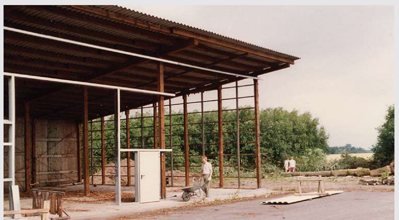
1991 – Umbau eines Holzlagerschuppens

Erwerb eines Grundstücks im Industriegebiet in Beelen. Umbau des vorhandenen Holzlagerschuppens in Beelen in eine Distributionshalle (1.200 m 2 ).