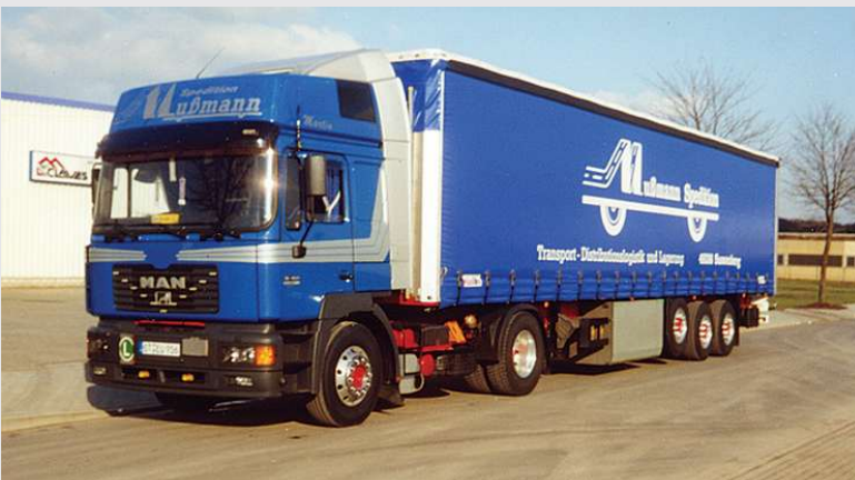
2005 – Fuhrpark der Firma Mußmann