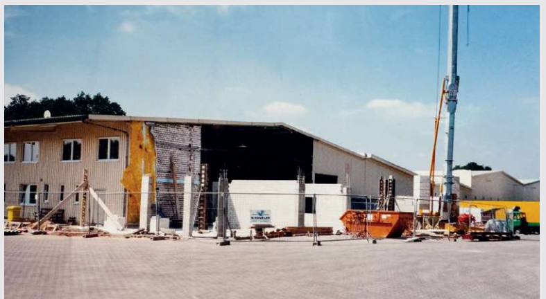
1999 – Bau Bürogebäude in Beelen