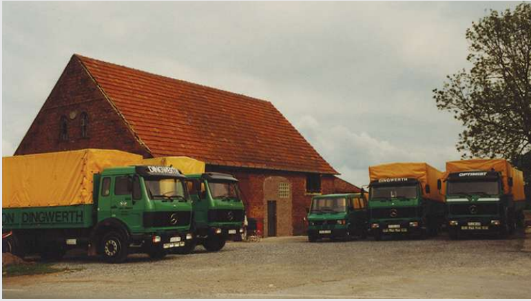
1983 – Standort Greffen an der Haller Straße