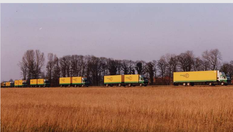
1993 – Umzug des Fuhrparks nach Beelen