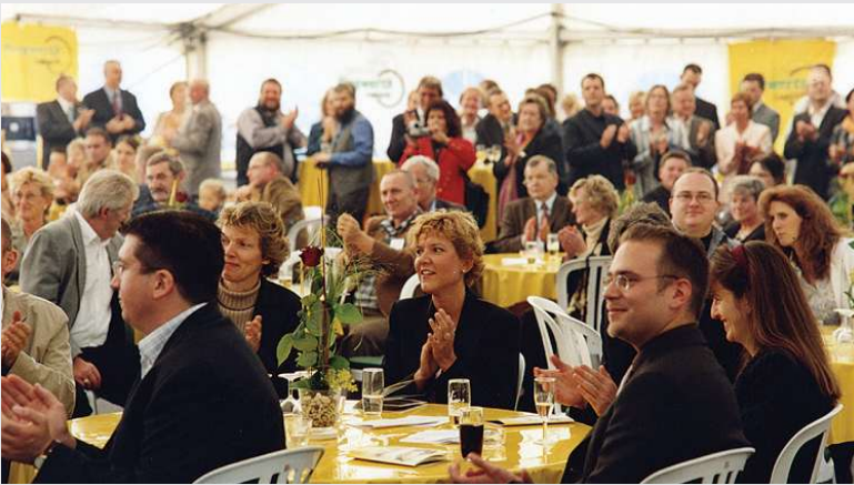
2004 – Unsere Gäste im großen Festzelt