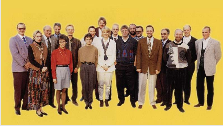
1994 – Die Belegschaft wächst