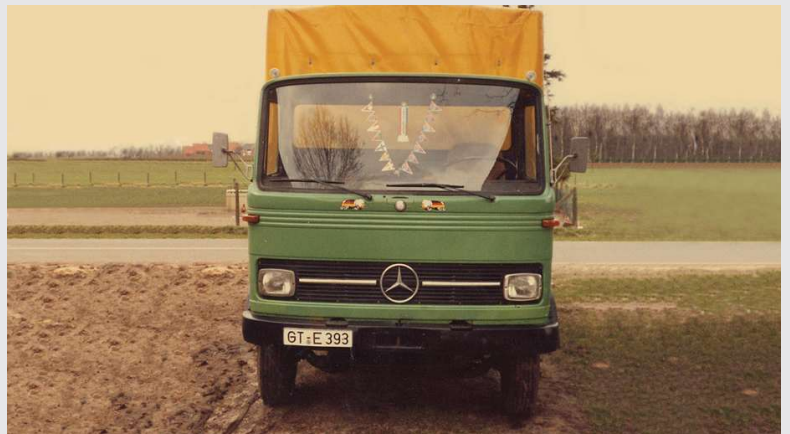
1980 – Der zweite LKW des Unternehmens

Erweiterung des Kundenstamms, vorwiegend in Holland und Belgien (grenzüberschreitender Nahverkehr).