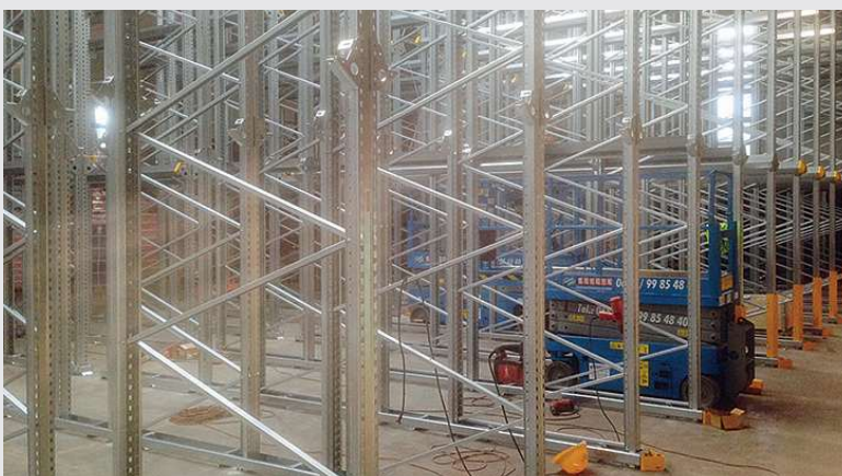
2014 – Einfahr-Regal-Anlage in Föhren

Erweiterung des Standortes Beelen um 2.100 m 2 .