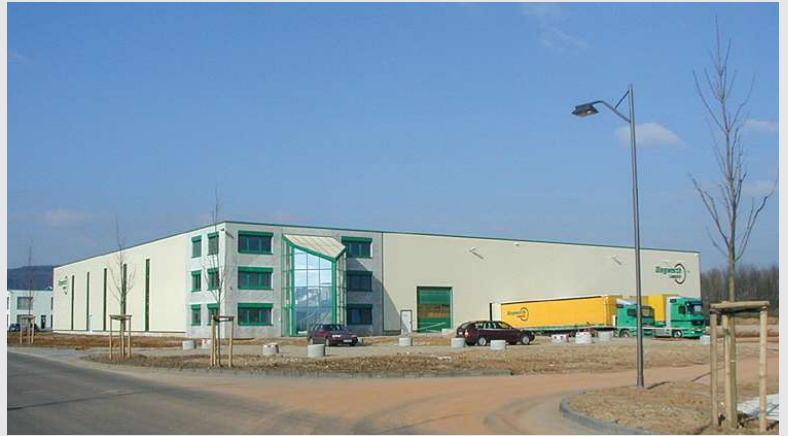
2002 – Neubau in Trier/Föhren

Inbetriebnahme einer neu erbauten Niederlassung in Trier/Föhren auf 3.600 m 2 .